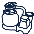
Groupe de filtration YZAKI 5,7m 3 /h